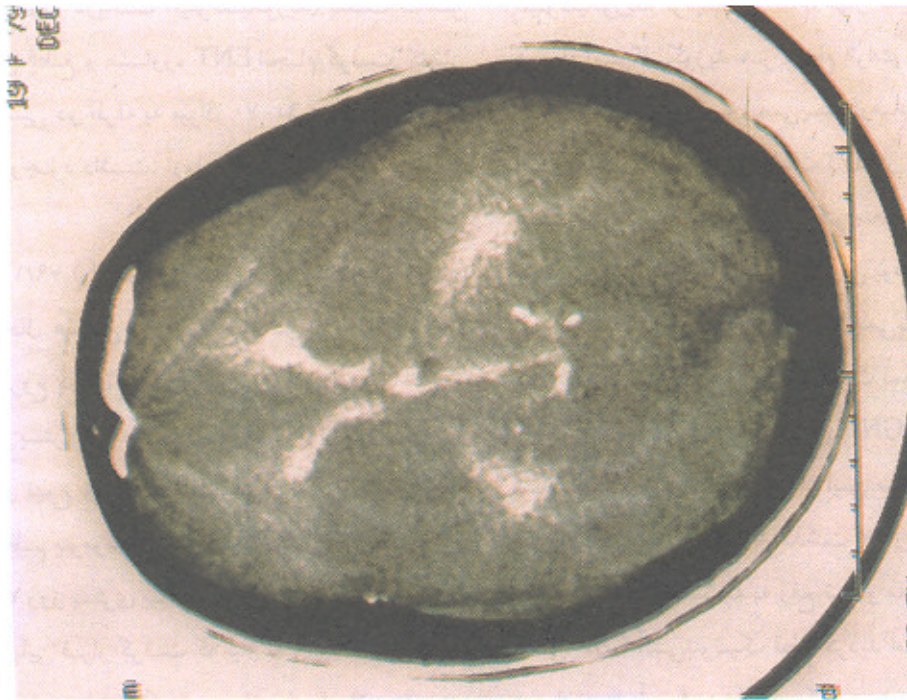
تصویر شماره ۱- سی تی اسکن مغز، نشان دهنده پنوموسفالوس