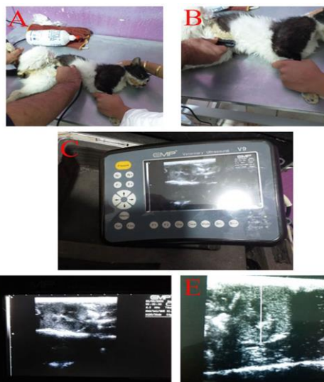
شکل ۱: تعیین محل کلیه با استفاده از سونوگرافی برای دو مرحله تزریق سلول در روزهای ۱ و ۱۴. (A) آماده کردن حیوان برای سونوگرافی و قراردادن آن در موقعیت مناسب. (B) پیدا کردن محل دقیق کلیه با استفاده از سونوگرافی. (C) تصویر کلیه گربه در دستگاه سونوگرافی مورد استفاده در این پژوهش (دستگاه سونوگرافی EMP ساخت کشور چین) (D) بررسی وضعیت دقیق کلیه حیوان مبتلا به بیماری مزمن کلیه با استفاده از امواج سونوگرافی. (E) تعیین محل دقیق تزریق سلول به کلیه که با خط سفید رنگ در تصویر نشان داده شده است.

گروه کنترل هیچ درمانی دریافت نکردند. گروه نرمال نیز در بیمارستان دامپزشکی برای معاینات معمول مراجعه می کردند. برای همه حیوانات، معاینه فیزیکی حیوانات، آزمایش اندازه گیری BUN، اوره، کراتینین سرم و ALT در روزهای ۱، ۳۰، ۶۰، ۹۰ و ۱۲۰ انجام شد. برای ارزیابی عملکرد کلیه از وزن مخصوص ادرار (SG) استفاده شد که مقدار کمتر از ۱/۰۳۵ در گربه ها نشان دهنده مشکلات کلیوی است. داده ها با استفاده از تحلیل واریانس دو طرفه (ANOVA) برای مقایسه های چندگانه با استفاده از SPSS software, version 20 (SPSS Inc., Chicago, IL, USA) و آزمون توکی مورد تجزیه و تحلیل قرار گرفت. سطوح P < 0.05 از نظر آماری معنادار در نظر گرفته شد.