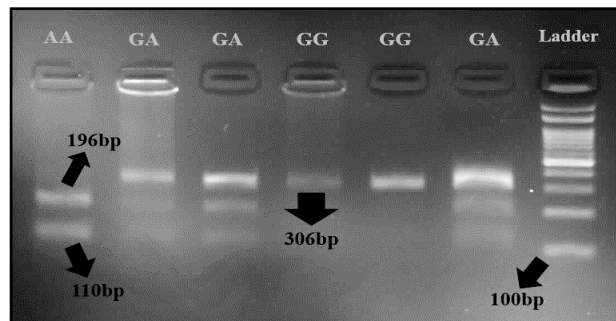
شکل ۳: تصویر ژل حاصل از هضم آنزیمی پلی‌مورفیسم مذکور با آنزیم محدودگر MseI