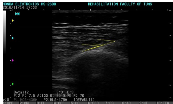
تصویر ۲: نمایی از اندازه‌گیری زاویه پینشن در عضله VMO.

در این مطالعه ۳۱ نفر خانم با وضعیت پای نرمال (FPI)، میانه سه و دامنه یک تا پنج) و ۳۱ نفر خانم با وضعیت پای پرونیت شده (FPI، میانه ۹ و دامنه ۱۲-۱۶) شرکت کردند که اطلاعات جمعیت شناختی نمونه‌ها در جدول ۱ ارائه شده است. نتایج ICC جهت اندازه‌گیری متغیر زاویه پینشن با استفاده از سونوگرافی، برای هر سه عضله موردبررسی در دامنه ۰/۷۵-۰/۹ و "خوب" به‌دست آمد (جدول ۲). ۱۳ در گروه خانم‌ها با پوسچر پای پرونیت، میانگین و انحراف معیار زاویه پینشن در عضله VMO (۳۲/۵۷±۴/۴۱)، VM (۱۶/۳±۴/۱۵) و VL (۱۶/۱۱±۲/۹) به‌دست آمد، درحالی‌که این مقادیر در گروه خانم‌ها با پوسچر پای نرمال به‌ترتیب (۳۳/۴۱±۴/۹۸) برای عضله VMO، (۱۸/۲±۴/۴۵) برای VM و (۱۷/۳±۲/۶) برای VL به‌دست آمد. در مقایسه بین گروهی، تفاوت معناداری بین زاویه پینشن در دو گروه مورد مطالعه یافت نشد (P=۰/۴۹) (جدول ۳).