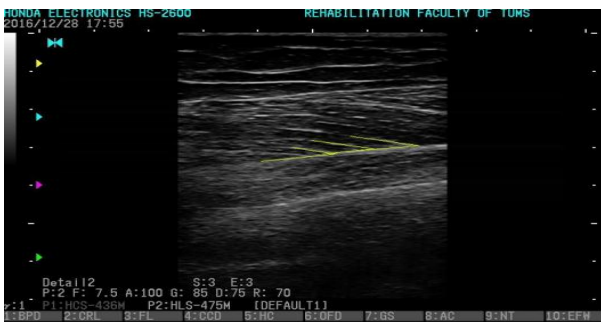
تصویر ۳: نمایی از اندازه‌گیری زاویه پینشن در عضله VM.