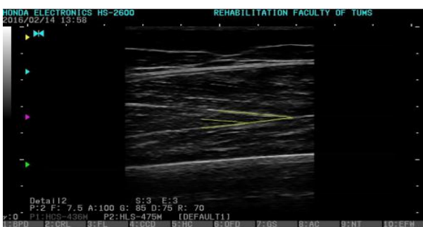
تصویر ۴: نمایی از اندازه‌گیری زاویه پینشن در عضله VL.

تصاویر توسط فیزیوتراپیست آموزش دیده در زمینه سونوگرافی انجام شد. تصاویر در فرمت JPEG و بدون‌اسم، جهت آنالیزهای بعدی ذخیره گردید. سه تصویر از هر عضله ثبت گردید درحالی‌که پروب بین تکرارها از روی پوست فرد برداشته می‌شد.