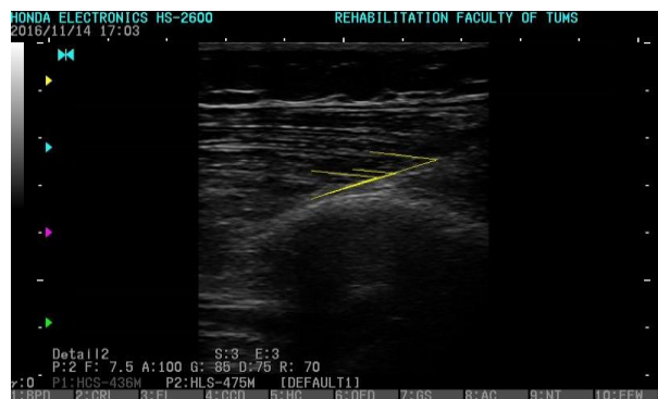
تصویر ۲: نمایی از اندازه‌گیری زاویه پینشن در عضله VMO.

تحلیل آماری، جهت بررسی نرمال بودن داده‌ها از آزمون شاپیرو-ویلک (Shapiro-Wilk test) استفاده گردید. جهت بررسی تکرارپذیری درون‌گروهی سونوگرافی از ضریب همبستگی درون‌گروهی (Intraclass correlation coefficient, ICC)، خطای معیار اندازه‌گیری (Standard error of measurement, SEM) و کمترین تغییر قابل تشخیص (Minimal detectable change, MDC) استفاده گردید. در صورتی که مقادیر ICC کمتر از ۰/۵ باشد، تکرارپذیری ضعیف، بین ۰/۵-۰/۷۵ باشد، تکرارپذیری متوسط، بین ۰/۷۵-۰/۹ باشد خوب و بالاتر از ۰/۹ تکرارپذیری عالی محسوب می‌گردد. ۳۳ از Independent T-test جهت مقایسه بین دو گروه افراد با وضعیت پای پرونیت شده و افراد با وضعیت پای سالم استفاده گردید. تحلیل‌های آماری با استفاده از SPSS software, version 22 (SPSS Inc., Chicago, IL, USA) صورت گرفت. سطح معناداری ۰/۰۵ در نظر گرفته شد.