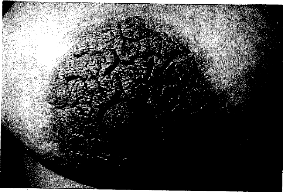
شکل ۱- هیپرکراتوز دو طرفه نیپل و آرنول