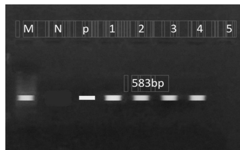
شکل ۱: ژن mecA در سویه‌های مقاوم به متی‌سیلین

در مطالعه فوق تمامی ۴۳ نمونه با استفاده از آزمایش‌های فنوتیپی به‌عنوان استاف اورئوس مورد تایید قرار گرفتند. همچنین ۴۳ نمونه از نظر وجود قطعه ژنی mec A مثبت بودند و به‌عنوان استافیلوکوکوس اورئوس مقاوم به متی‌سیلین (MRSA) در نظر گرفته شدند. باتوجه به