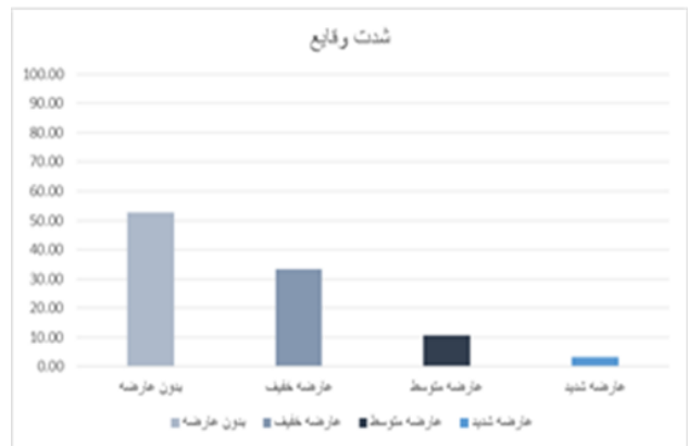
نمودار ۳: توزیع فراوانی خطاهای پزشکی به تفکیک شدت