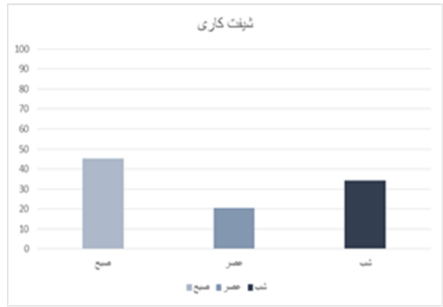
نمودار ۱: توزیع فراوانی خطای پزشکی به تفکیک زمان رخداد (شیفت)

علت ماهیت آموزشی بیمارستان موردبررسی و امکان کاهش تمرکز کادر درمانی به علت این افزایش تمرکز افراد باشد. با این حال در مطالعات بسیاری شبکاری یکی از فاکتورهای خطر بروز خطای پزشکی، به علت خستگی پرستاران، بوده است. برای مثال مطالعه Soleimani و همکاران نشان داد افزایش شیفت شب باعث کاهش سلامت عمومی پرستاران می‌شود. ۱۹ و یا در مطالعه دیگری توسط Suzuki و همکاران نیز نشان داده شد که بین شبکاری، کار شبانه پرستاران و خطاهای پرستاری آنها همبستگی وجود دارد. ۲۰