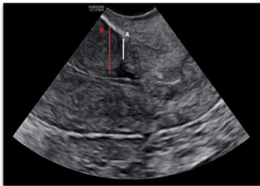
شکل ۱: تصویر TVS از سگمان تحتانی رحم که در آن نشان داده شده است. خط سفید (A) نمایانگر RMT و خط قرمز (B) نمایانگر AMT است.