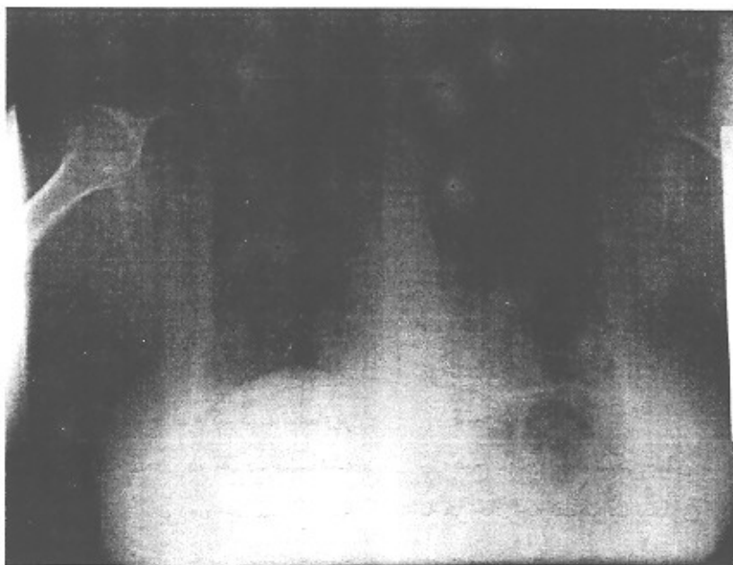
شکل ۲- تصویر رادیوگرافیک بیمار