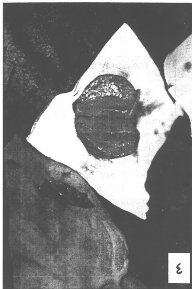
شکل ۴- تصویر نمونه ارسالی

با توجه به اینکه هیچ تست اختصاصی برای رد یا تأیید سارکوئیدوز بطور خاص وجود ندارد و این بیماری را از روی مجموعه شکایات و علائم بالینی و آزمایشگاهی حدس می زنند و با کمک نتایج آسیب شناسی به یک جمع بندی در مورد امکان اثبات تشخیص بیماری نائل می گردند، این مورد نمونه ای از تظاهرات غیر معمول سارکوئیدوز در مراجعه به متخصصین گوش و گلو و بینی می باشد (۸،۷).