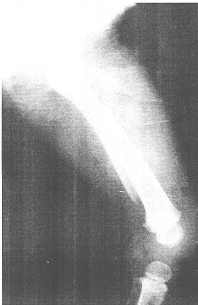
شکل ۱- رادیوگرافی شکستگی تنه استخوان ران در کودک

۴ ساله که با جایجایی و زاویه دار شدن زیاد نیست. با گچ