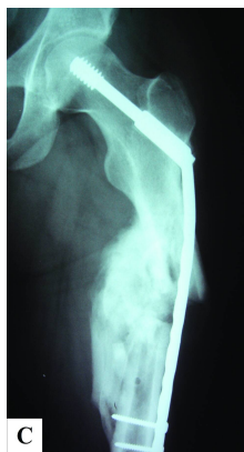
شکل- ۲: A- رادیوگرافی بیمار شماره ۱۱، B- رادیوگرافی بعد از عمل بیمار شماره ۱۱، C- رادیوگرافی درمان بعد از گذشت یک سال از عمل

پایان سال اول صورت گرفت. جوش خوردن تمام بیماران در نهایت مشاهده شد (شکل ۲) (جدول ۱).