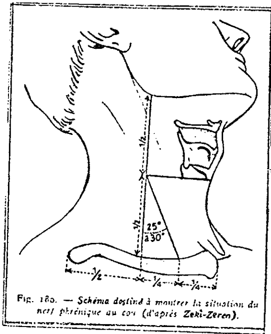
شکل ۱ -

۵۴ نمونه تشریح شده صورت گرفت مبنای اندازه گیری خطی