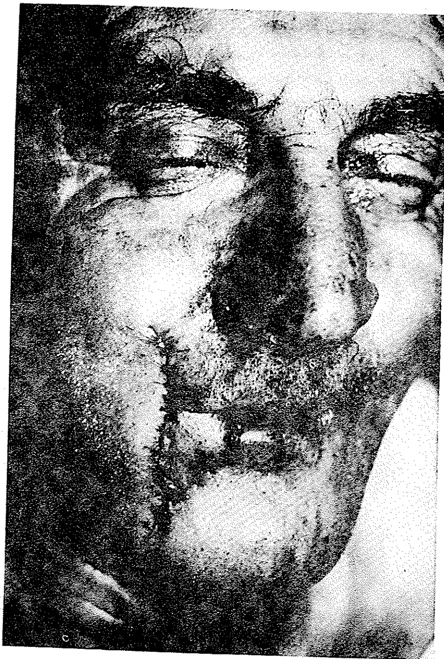
۲- ABBE FLAP (۱-۱۶):

تمام لایه تا ورمیلیون قطع و از طرف دیگر تمام لایه تا نزدیکی ورمیلیون خط برش را متوقف بطوریکه شریان لابیال در داخل پدیкул قرار داشته باشد و پس از آماده کردن فلاپ از لب بالا آنرا با اندازه ۱۸۰ درجه به پائین چرخانده و در داخل دیفکت برش تومور قبلی قرار می دهیم و دیفکت ایجاد شده از فلاپ بالا را در سه لایه دوخته و فلاپ را نیز در پائین در سه لایه