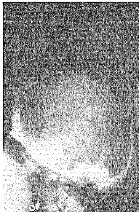
شکل ۲: رادیوگرافی جمجمه بیمار اول - که بزرگی زمین ترکی با تخریب زائده های کلینوئید در آن مشاهده می شود