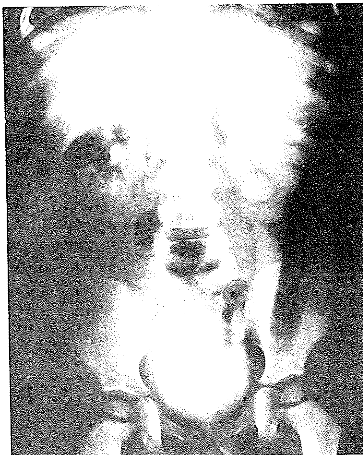
۱- آروگرافی داخل وریدی هیدروارترو نفروز در سمت چپ را نشان میدهد