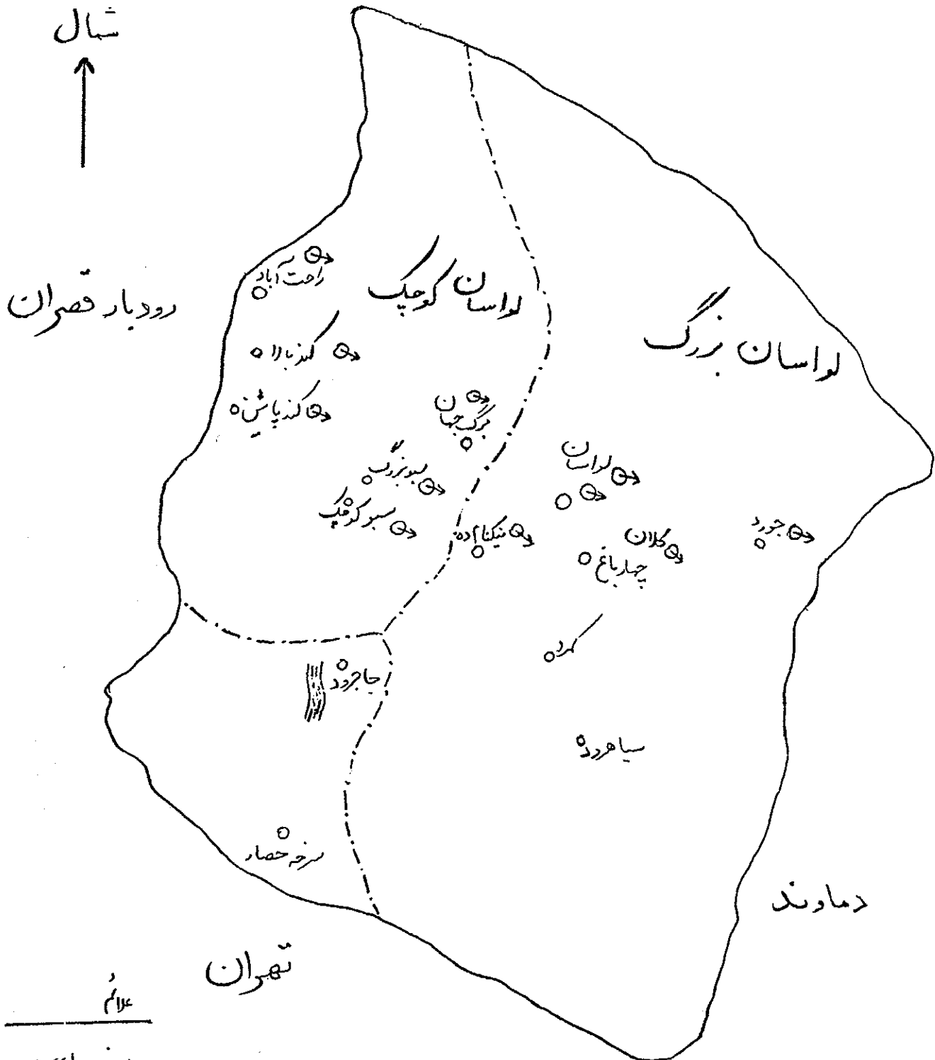
" محل تقریبی نمونه برداری از آبهای خوراکی منطقه لواسانات "

۷ ها بر حسب اشل لگاریتمی درجه بندی شده است که میزان