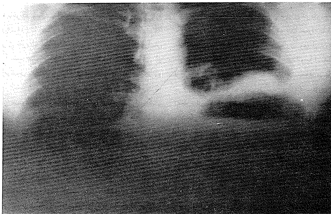
نمای هیدروآئریک (آب و هوا) قسمت اعظم نیمه قفسه صدري چپ را پر کرده است و سطح دیافراگم نامنظم است.

در رادیوگرافی ریتین نمای آب و هوا دیده می‌شود که تقریباً نیمه تحتانی قفسه صدري طرف چپ را فرا گرفته و حد بالائی آن نامرتب است (شکل یک) در ضمن سایه قلب و مدیاستن بطرف راست رانده شده است. رادیوگرافی معده و اثنی عشر با ماده حاجب معده پر شده از ماده حاجب در داخل قفسه سینه تا حد پنجمین فضای بین دنده‌های چپ نشان می‌دهد و تشخیص فتق دیافراگم ضربه‌ای را مطرح می‌نماید (شکل ۲). در تاریخ ۵۴/۸/۶ بیمار از راه قفسه صدري از ششمین فضای بین دنده‌های طرف چپ تحت عمل