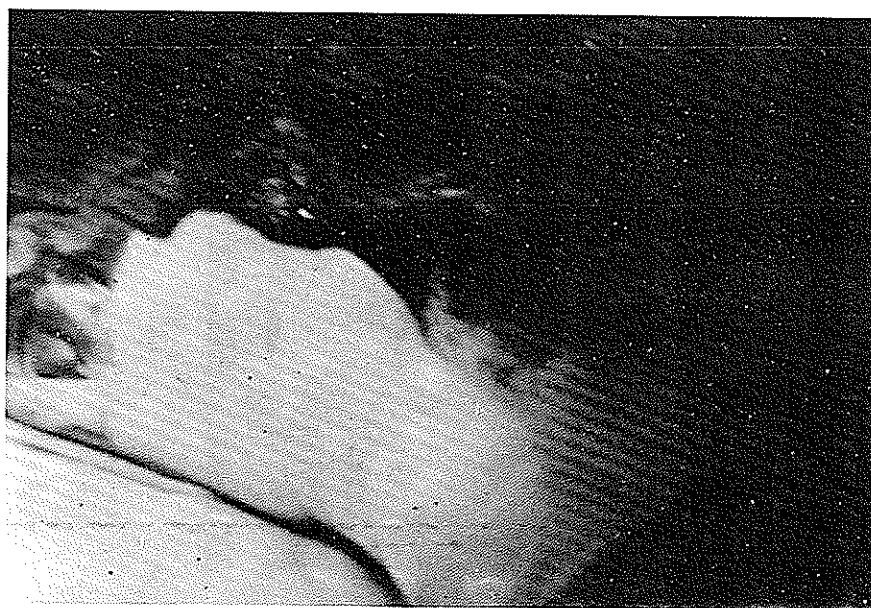
شکل ۵- حفره دیورتیکول مجرای ادراری کاملاً "از نسوج اطراف جدا شده است .