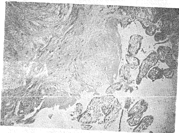
عکس شماره ۱ - نمای میکروسکوپی پلاسنٹا اکرتا ، فقدان دسیدوا و وجود پرزهای کوریون را چسبیده به رشته‌های عضلانی نشان میدهد.

۳- کافی نبودن دژنرسانس اندومتر متعاقب زایمان‌های مکرر که فاصله بین آنها نیز کم بوده است. ۴- جایگزینی ( Implantation ) جفت در درون رحم در محل‌هایی که طبیعتاً دسیدوا کمتر از معمول میباشد مانند قسمت تحتانی رحم مجاور سرویکس و یا قسمت بالای رحم مجاور دهانه لوله [۱ و ۶ و ۷ و ۱۰].