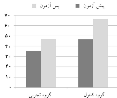
نمودار ۱: بیان ژن ابستاتین در دو گروه قبل و بعد اجرای پروتکل تمرینی

هدف از پژوهش حاضر بررسی اثر یک جلسه تمرین هوازی بر بیان ژن ابستاتین لنفوسیت زنان تمرین کرده بود. نتایج تحقیق حاضر نشان داد که یک وهله تمرین هوازی سبب افزایش معنی‌داری در بیان ژن ابستاتین لنفوسیت‌ها نمی‌گردد. در این زمینه، Ghanbari-Niaki به بررسی اثر یک جلسه تمرین با شدت‌های مختلف بر سطوح پلاسمایی ابستاتین پرداخت، نتایج این پژوهش حاکی از آن بود که سطوح ابستاتین پلازما در پاسخ به یک جلسه تمرین مقاومتی در هیچ‌یک از شدت‌های مختلف تمرین، تغییر معنی‌داری نیافت. ۱۹ Manshourی به بررسی اثر یک برنامه تمرین بی‌هوازی کوتاه‌مدت بر