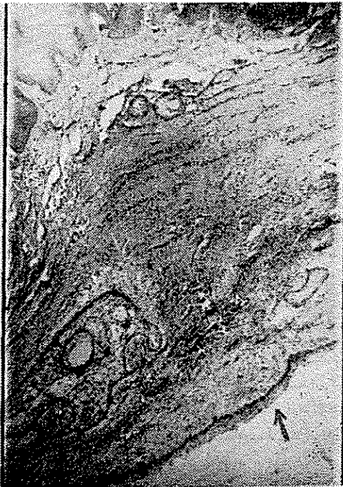
شکل ۴ - با درشتنمایی ضعیف در قسمت گوشه راست بالا با پوشش مخاطی و در گوشه چپ پایین جدار کیست (فلش) مشاهده می گردد .

نمای میکروسکوپی - در مطالعه میکروسکوپی در برش های متعدد پوشش مخاطی مالبیگی ملاحظه میگردد که دارای نمای نسبتا طبیعی است. بافت همبند زیر مخاط خیز دار و پررنگ بوده و ارتشاح سلولهای آماسی تک هسته بطور پراکنده در آن مشاهده میگردد. در لایه های عمقی تر بافت متراکم تر گشته و در بعضی نواحی در لایه آن پرولیفیر - اسیونی از بافت اپی تلیالی جلب نظر میکند. در جهت مرکز بافت ساختمان حفره بی دیده میشود که لایه طبق اپیتلیالی (در اکثر نواحی تنها از چند لایه سلولی) اطراف آنرا احاطه مینماید (شکل ۴) و در بعضی از مناطق با مشاهده افزایش ضخامت واضح در لایه اپی تلیالی،