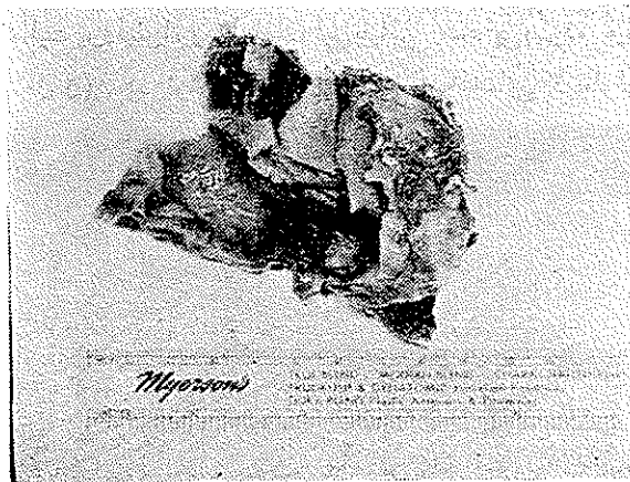
شکل ۳ - عکس نمونه ارسالی .

قبل از عکسبرداری قطعاتی از نواحی مختلف بافت اخیر جیت مقاطع میکروسکوپی برداشت گردیده بنا بر این بافت کوچکتر از ابعاد اصلی می باشد. در قسمت مرکز حفره تو خالی و جدار روپیم خوابیده آن مشهود است.