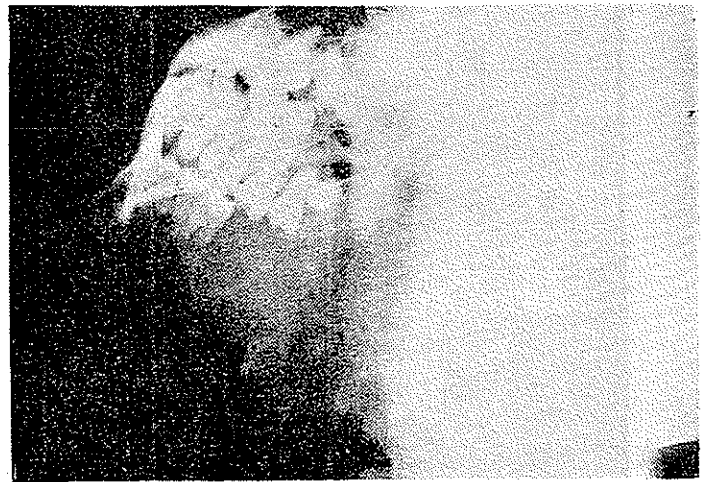
شکل ۲ - نوار ظریف رادیوگرافیک که نشانه حدود تحتانی فک می باشد بتدریج در جیت خلفی بکلی محو گردیده است .

پس از اقدامات لازم اولیه بیمار از طریق خارج دهانی