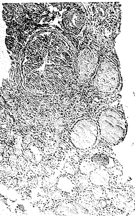
آمیلولز کلیه همراه با پیلو نفریت مزمن

یکصد و بیست و نه مورد بیمار مبتلا به سندروم نفروزی مسورد بحث این مقاله همه در بخش طبی يك بیمارستان پهلوی بستری و تحت مطالعه و درمان بوده اند. در جدولهای موجود خصوصیات آنها از نظر جنس و سن، مدت بیماری، علائم بالینی و آزمایشگاهی و بافت شناسی بطور مجمل منعکس شده است. از نظر جنس باید یاد آور شد که ۷۳ مورد مرد و ۵۴ مورد زن بوده اند. از نظر سن در دو سوم موارد سن بیماران کمتر از ۲۵ سالست.