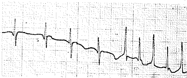
شکل ۴ - حمله تکیکاردی دهلیزی و برگشت آن به ریتم سینوزال

است که موج دلنا در الکتروکاردیوگرام ضبط نمیشود باید توجه داشت که در ضمن حملات تکیکاردی (شکل ۴) الکتروکاردیوگرام بحالت عادی برمیگردد. شیوع سندرم WPW بین ۱ تا ۳ درصد تخمین زده شده است ۶۰ تا ۷۰ درصد