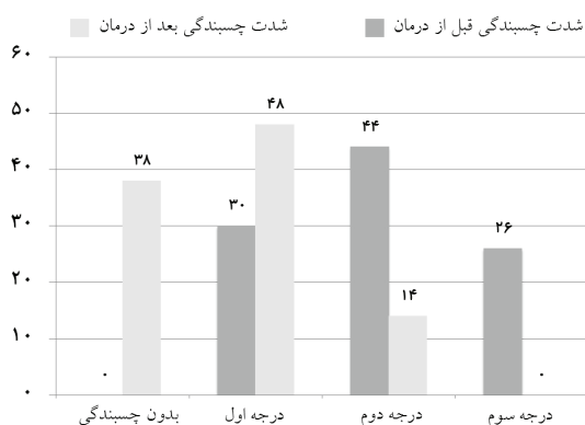
نمودار ۲: فراوانی شدت چسبندگی قبل و پس از درمان

یا فرد مراقبت‌کننده بیمار داده شد. علاوه بر آن جزوه‌ای به صورت مکتوب در اختیار وی قرار گرفت. هشت روز بعد از شروع درمان بار دیگر بیمار تحت معاینه قرار گرفته و مقدار پاسخ‌دهی به درمان به صورت زیر تقسیم‌بندی شد: