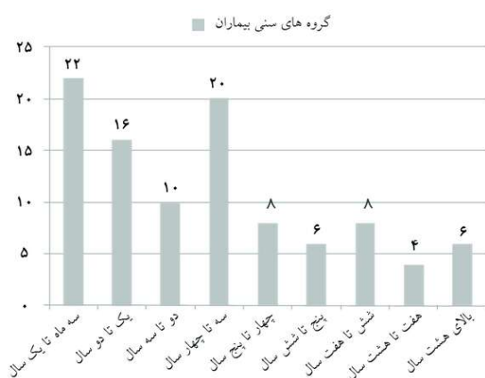
نمودار ۱: فراوانی گروه‌های سنی بیماران مبتلا به چسبندگی لایا

گردیدند. در نهایت ۱۰۰ بیمار در آنالیز نهایی شرکت داده شدند. بیشترین فراوانی سنی در کودکان زیر یکسال و کمترین فراوانی در کودکان ۷-۸ سال وجود داشت (نمودار ۱). بیشترین فراوانی شدت چسبندگی قبل از درمان مربوط به چسبندگی درجه دوم (۴۴ مورد از ۱۰۰ مورد) و پس از درمان مربوط به چسبندگی درجه اول (۴۸ مورد از ۱۰۰ مورد) بود (نمودار ۲). در مجموع ۸۶٪ بیماران به درمان پاسخ داده بودند و تنها ۱۴٪ هیچ‌گونه بهبودی نداشتند. در هیچ‌کدام از بیماران شدت چسبندگی بدتر نگردیده بود. قبل از درمان ۱۴ کودک دارای عفونت ادراری و ۲۲ نفر دارای سایر علایم از جمله هماچوری