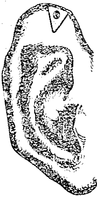
لاله گوش با برش ساده

از ۵۰ سال قبل تا کنون در سانهای مختلفی برای این عارضه پیشنهاد شده است مثل رادیوتراپی - رادیوم قرابیی برف کاربونیکیک ( Cryocautery ) - الکتروکواگولاسیون - کورتاژ و بالاخره تزریق نوکائین و کورتیکوسترئوئید و غیره و بهترین درمان فقط بوسیله بیستوری جراحی بدست میآید و بس . در روشهای بالا معمولاً ۸۸٪ عود عارضه دیده میشود در صورتیکه با بیستوری عود آن بیشتر از ۱۸٪ نیست .