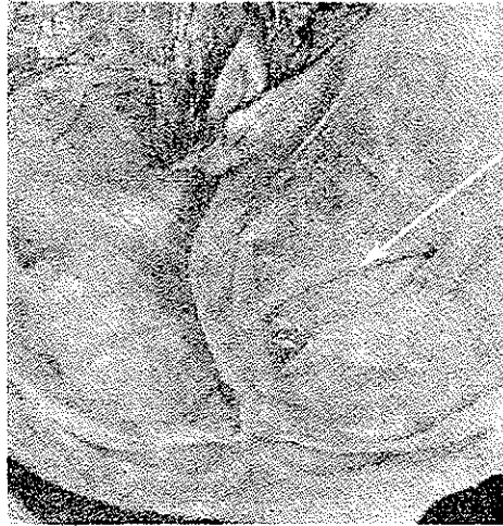
شکل ۲- حوضچه وریدی طرف راست پرده مخچه که وابسته به چرخش هروفیل است

آنها بیشتر اوقات در طرف چپ قرار دارند ( ۵ مورد ) در حالیکه در طرف راست فقط ۱ مورد حوضچه طرفی دیده شد .