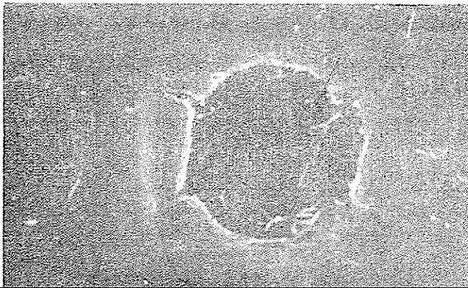
شکل ۳- آبگونه هیداتیک و آنتی سرم ضد پروتئین های سرم گوسفند (آنتی سرم ضد گوسفند) تهیه شده در آزمایشگاه سرم شناسی