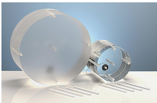
شکل ۱: فانتوم های سر و تنه

در این رابطه CTDI c دوز به دست آمده در مرکز و CTDI p دوز به دست آمده در حفره های محیطی فانتوم های سر و تنه می باشد. فانتوم های سر و تنه دو عدد استوانه از جنس Polymethylmethacrylate (PMMA) با قطر ۱۶ و ۳۲ و طول ۱۵ سانتی متر می باشند. بر روی این استوانه ها یک حفره در مرکز و چهار حفره دیگر نیز در کناره محیطی