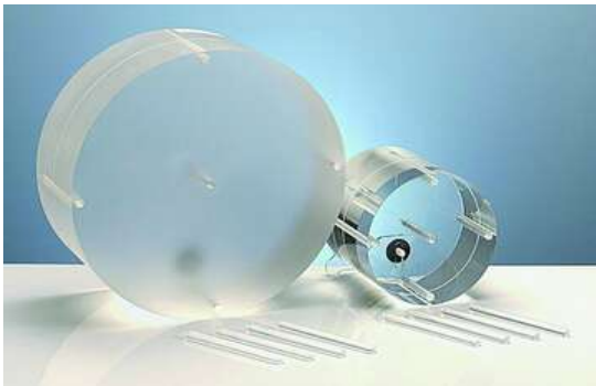
شکل ۱: فانتوم های سر و تنه

در این رابطه CTDI c دوز به دست آمده در مرکز و CTDI p دوز به دست آمده در حفره های محیطی فانتوم های سر و تنه می باشد. فانتوم های سر و تنه دو عدد استوانه از جنس Polymethylmethacrylate (PMMA) با قطر ۱۶ و ۳۲ و طول ۱۵ سانتی متر می باشند. بر روی این استوانه ها یک حفره در مرکز و چهار حفره دیگر نیز در کناره محیطی