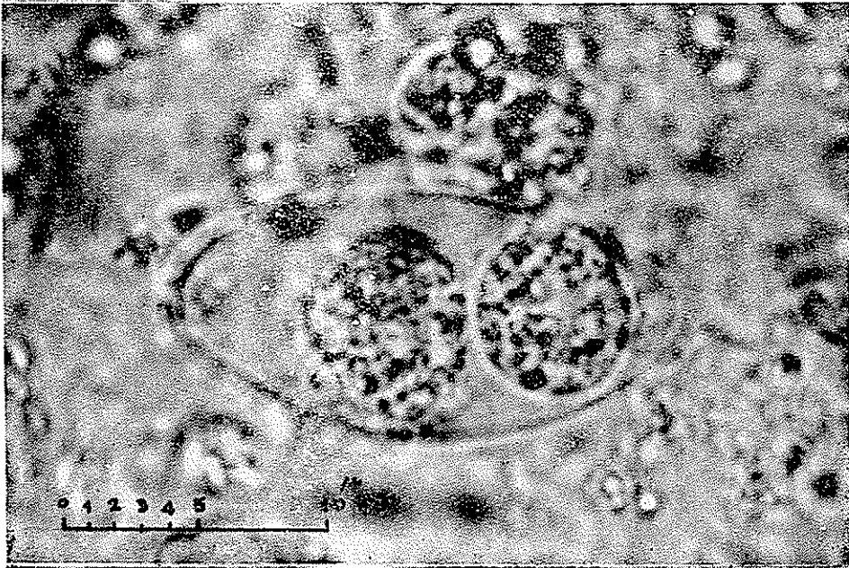
ائوسسیست ایزوسپورا هومینیس Sporoblast محتوی دو اسپروبلست

در حدود ۳۳ - ۲۰ × ۱۶ - ۱۰ اندازه دارند و دارای دو جدار نازک بوده و در موقع دفع دارای یک سلول و یا دواسپروبلست میباشند ( شکل ۲ ) که دارای دانه‌های شفاف