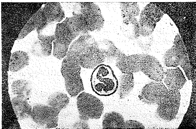
نمای ریبینی گویچه‌سفید چند هسته‌ای معمولی که فاقد زائده

فقط نوتروفیل‌های رسیده باهسته های تقسیم شده باید مورد آزمایش قرار گیرد تا اینکه حداقل ۶ جسم گریزشکل کامل دیده شود ( هسته ماده ) ولی اگر ۵۰۰ نوتروفیل مورد آزمایش قرار گیرد و هیچکدام محتوی زوائد مذکور نباشد باید نتیجه آزمایش را مذکر شناخت معمولا تعداد چوب‌طلها باسن و یا سایر عوامل فرق میکند لهذا ممکن است در يك مورد برای یافتن ۶ عدد آنها فقط صد نوتروفیل امتحان