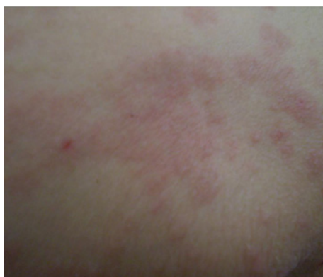
شکل - ۳: نمای نزدیک ضایعات