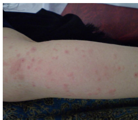
شکل - ۲: ضایعات اندام‌ها

برای بیمار درمان با کلوتنازول موضعی به میزان ۱/۵ لوله ۳۰ گرمی روزانه برای هفت روز و سپس کاهش تدریجی میزان دارو به صورت هفتگی شروع شد. همچنین برای کاهش علائم خارش و تحریک بیمار از کلرفنیرامین خوراکی به میزان ۱۲ میلی‌گرم روزانه در سه دوز منقسم استفاده شد. ضایعات بعد از یک هفته ناپدید شده و خارش بیمار به کلی از میان رفت. در پی‌گیری‌های بعدی سه و شش ماه بعد از زایمان مادر و نوزاد هر دو کاملاً سالم و بدون هیچ گونه عارضه پوستی ارزیابی شدند.