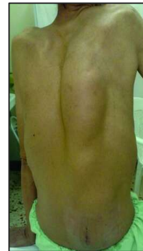
شکل ۱: آقای ۶۱ ساله با شکایت توده در پشت از شش سال قبل با رشد تدریجی