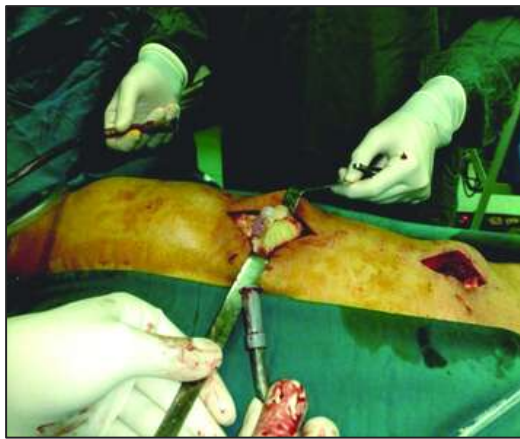
شکل ۳: خارج شدن اسکولکس‌ها در حین جراحی