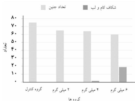
نمودار-۳: مقایسه میزان بروز شکاف کام و لب در گروه‌های کنترل و آزمایشی