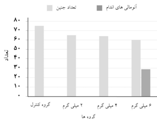
نمودار-۲: مقایسه میزان بروز آنومالی‌های اندام در گروه‌های کنترل و آزمایشی

غلظت پلاسمایی را بین یک تا دو ساعت ایجاد می‌کند. ۱۹ مطالعات بر روی این خانواده دارویی از سال‌های ۱۹۶۰ آغاز گردید. ۳ در مطالعات انجام شده، بروز شکاف کام و آنومالی‌های اندام گزارش شده است. ۱۲-۱۳ با توجه به این‌که آلپرازولام به عنوان کم‌خطرترین داروی خواب‌آور ضد تشنج معروف شده است، مصرف خودسرانه این دارو با دوزهای بالا رایج گردیده است. ۱۹ ماه‌های اول بارداری دوران حساس شکل‌گیری جنین و دوران ارگانوژنز می‌باشد، با توجه به اینکه بعضی از خانم‌ها در ماه‌های اول از بارداری خود خبر نداشته و یا ناآگاهانه در کم‌خوابی و یا بنا به ضرورت درمان بعضی بیماری‌ها، از این دارو استفاده می‌کنند، این امر می‌تواند موجب تأثیر منفی بر ارگانوژنز و تکامل طبیعی جنین گردد. ۱۴ طبق نتایج به‌دست آمده از جنین‌های سزارین شده ۱۷ روزه گروه کنترل در بررسی ماکروسکوپی و مورفولوژی ظاهری، بدن خمیدگی طبیعی C شکل خود را حفظ کرده و اندام‌ها در وضعیت طبیعی خود قرار گرفته‌اند. سر و صورت و پوزه شکل گرفته و چشم‌ها و گوش‌ها و بینی و دهان وضعیت طبیعی خود را به‌دست آورده‌اند. در این گروه (کنترل) کلیه جنین‌ها حالت طبیعی داشتند. در بررسی‌های میکروسکوپی گروه کنترل نیز مورد خاصی دیده نشد و همگی حالت طبیعی داشتند. در مطالعه ما، گروه‌های آزمایشی ۴ mg/kg/day و ۲، در حد مجاز آلپرازولام دریافت کرده‌اند. در بررسی‌های مورفولوژیک ماکروسکوپی، مشاهده گردید که نمای ظاهری جنین‌ها از نظر ارگانوژنز و قرارگیری اندام‌ها در جای طبیعی خود تفاوت بارزی با گروه کنترل ندارند و اختلاف این دو گروه با گروه کنترل معنی‌دار نمی‌باشد. در بررسی نمونه‌ای گروه آزمایشی ۶ mg/kg/day، مشاهده