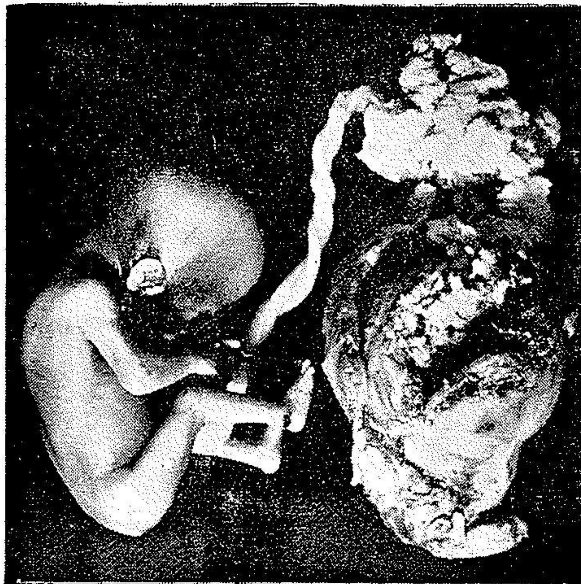
جنین چهارماهه در شاخ فرعی زهدان دو شاخ که منجر به پاره شدن زهدان فرعی شده است