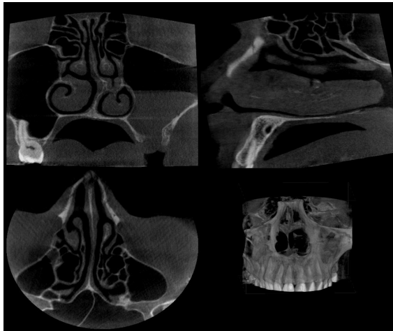
شکل-۲: نمونه‌هایی از تصاویر CBCT مشاهده شده