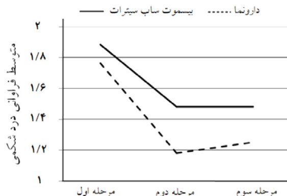
نمودار- ۱: کاهش فراوانی درد شکمی در طول مطالعه به تفکیک در دو گروه

سندرم روده تحریک‌پذیر با ارجحیت نسبی علامت یبوست، البته تعدادی از این بیماران را نمی‌توان در هیچ کدام از این دو گروه تقسیم کرد، به طوری که در دوره‌ای از زمان علامت اسهال و در دوره‌های دیگر علامت یبوست غالب می‌شود. در این بیماری علاوه بر درد شکمی علائم گوارشی دیگر مثل احساس نفخ شکمی، آروغ زدن اغلب به طور شایع دیده می‌شود هر چند که برای تشخیص بیماری وجود آنها الزامی نیست. ۴ برای تشخیص این بیماری در اکثر مطالعات از معیارهای Rome استفاده شده بود که ما نیز در مطالعه خود از آخرین معیاری موجود Rome یعنی Rome III استفاده کردیم. پاتوژنز احتمالی این بیماری به طور کامل شناخته شده نیست ولی علتی که در مطالعات اخیر به آن توجه بیشتری شده است تغییر در فلور میکروبی طبیعی دستگاه گوارش می‌باشد. ۵ به علاوه مطالعاتی نیز وجود دارند که نشان می‌دهند درمان کوتاه‌مدت با آنتی‌بیوتیک منجر به بهبودی قابل توجهی در علائم گوارشی این بیماران شده است. ۶ بنابراین ما نیز در این مطالعه اثر آنتی‌بیوتیک غیرقابل جذب بیسموت ساب‌سیترات را در گروهی از این بیماران که با علامت ارجح اسهال مراجعه کرده بودند مورد مطالعه قرار داده و اثر آن را با گروه مشابه دیگری که دارونما را دریافت کرده بودند، مقایسه کردیم. ما مطالعه