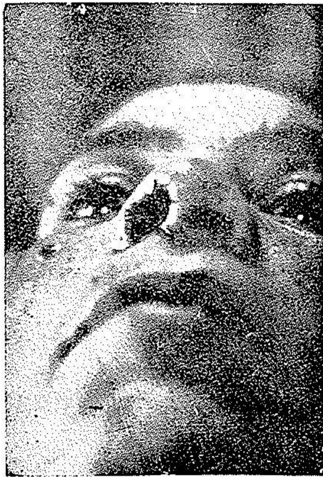
همان بیمار پس از عمل