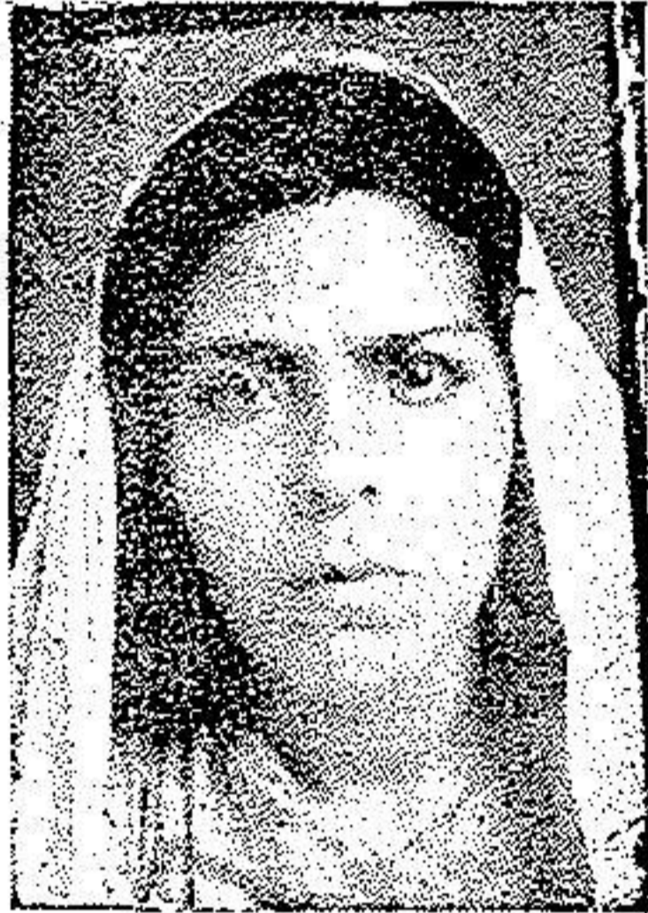
بعد از عمل