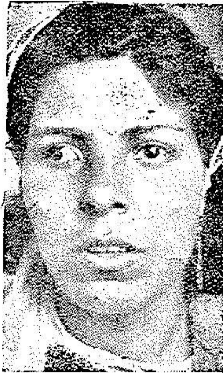
قبل از عمل