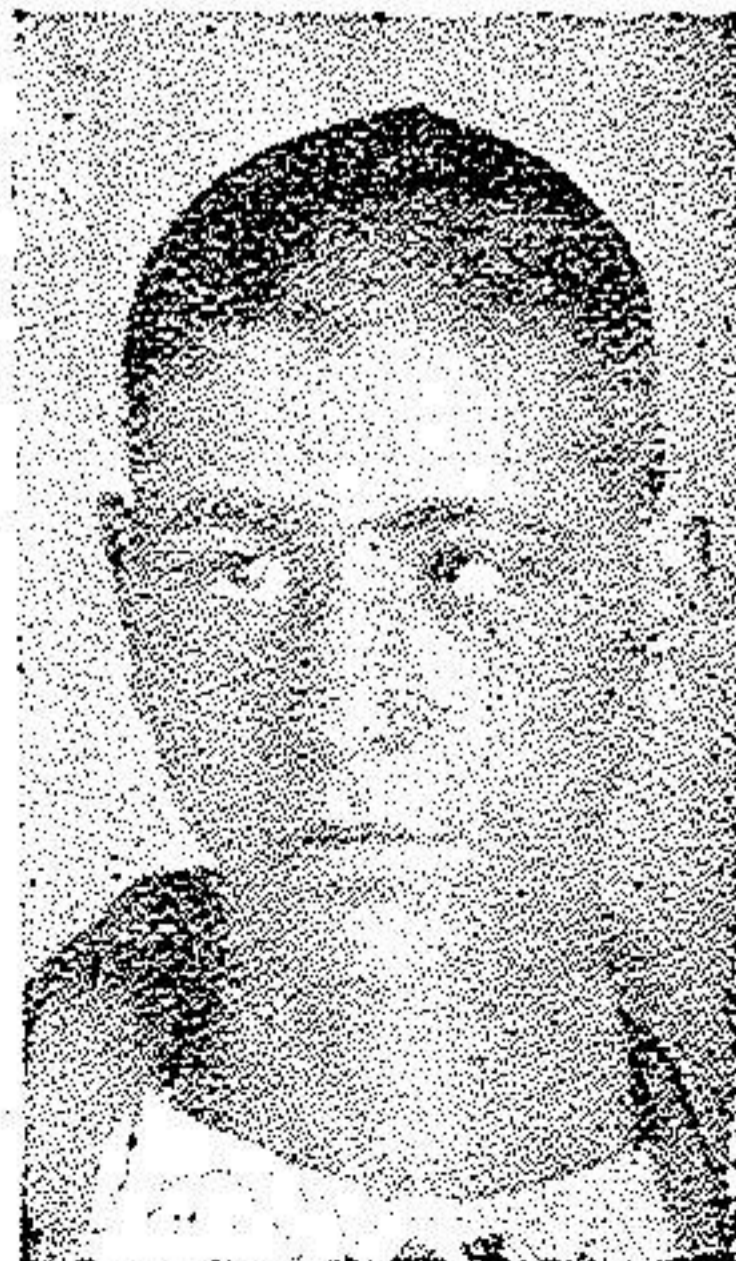
قبل از عمل