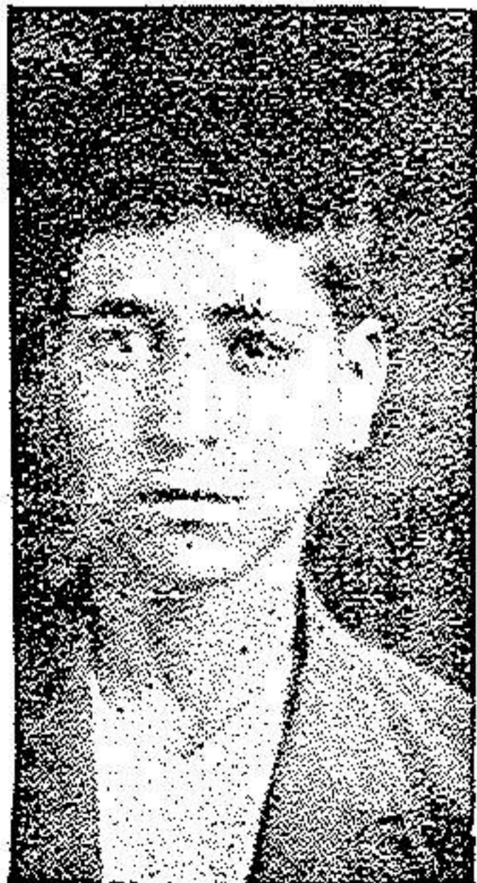
بعد از عمل