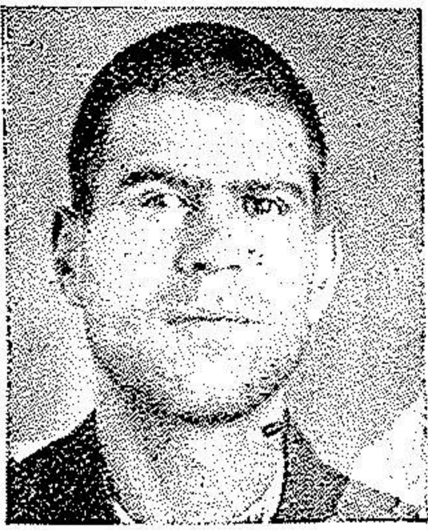
بعد از عمل