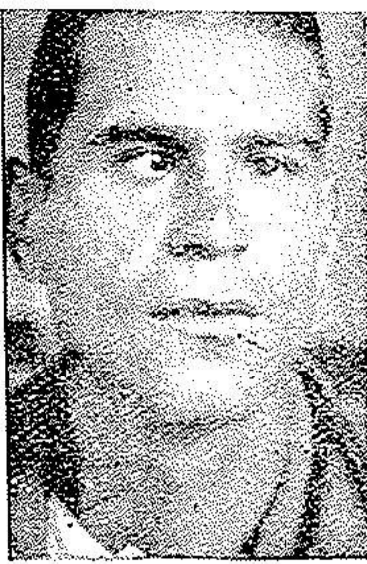
قبل از عمل