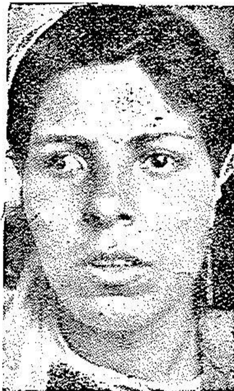
قبل از عمل