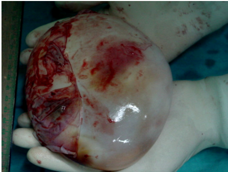
شکل-۳: نمای انوکلسیون (کیست سالم خارج شده) در درمان جراحی کیست هیداتید