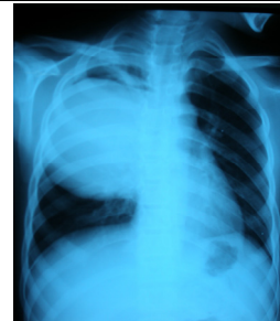
شکل-۲: نمای رادیولوژی و سی تی اسکن کیست در حال پاره شدن در جوان ۱۷ ساله (Crescent sign)

مبتلا در ۳۲٪، لوبکتومی ۷۴/۷٪، لوبکتومی و سگمنتکتومی ۱/۴٪ و پنومونکتومی ۰/۹٪ بود. ۲/۵٪ بیماران بیش از یک بار عمل شدند. زمان بستری اکثراً بین ۵-۱۵ روز بود (۷۵/۷٪). موربیدیتی ۸/۷٪ شامل عفونت زخم ۱۵ بیمار (۱/۵٪)، فضای باقیمانده در ۳۵ بیمار (۳/۴٪) شایع ترین عوارض بودند و مورتالیتی دو مورد به علت سن بالا و نارسایی تنفسی بعد از عمل بود (۱٪). حداقل فالوآپ دو سال و عود در ۲/۵٪ موارد دیده شد که ۹۵/۷٪ موارد عود درمان توأم جراحی و طبی و ۴/۳٪ درمان طبی شدند. در تمامی بیماران پس از جراحی با آلبندازول به مدت شش ماه درمان شدند.