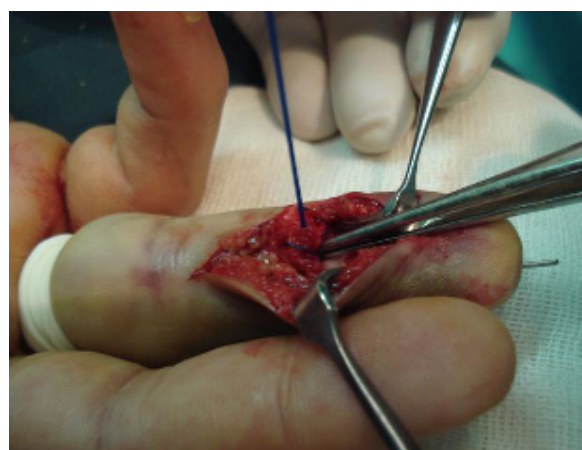
شکل-۱: نحوه گره زدن

پس از خروج آنژیوکت از ناخن نخ لوپ رد می‌شود و روی دکمه گره‌های متعدد زده می‌شود