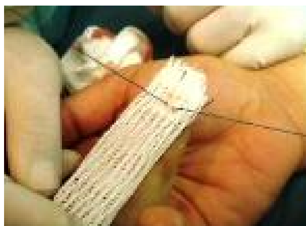
شکل-۵: نحوه گره زدن بر روی تکمه pull out

تاندون گره زده می‌شود به طوری که گره نخ دور تا دور تاندون قرار گیرد.