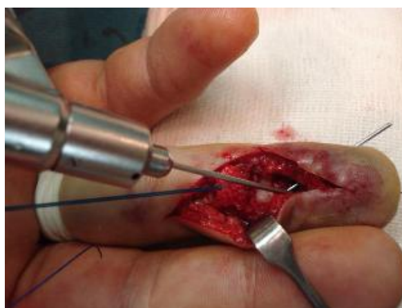
شکل-۲: سوراخ کردن استخوان جهت عبور دادن نخ لوپ

در هنگام دریل کردن استخوان از کناره ناخن محل خروج دریل چک می‌گردد.