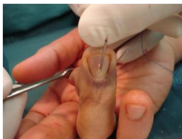
شکل-۳: محل خروج آنژیوکت از ناخن

در هنگام دریل کردن استخوان از کناره ناخن محل خروج دریل چک می‌گردد.