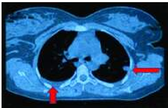
شکل ۲: ندول در لوب تحتانی ریه چپ و پلورال افیوژن در همی‌توراکس راست

حدود سه لیتر خون، دو لیتر لخته همراه با مقدار زیادی وزیکول از داخل شکم ساکشن شد. میومتر رحم در ناحیه فوندوس کاملاً باز شده بود. هم‌زمان ساکشن کورتاژ انجام شده محتویات رحم که پر از