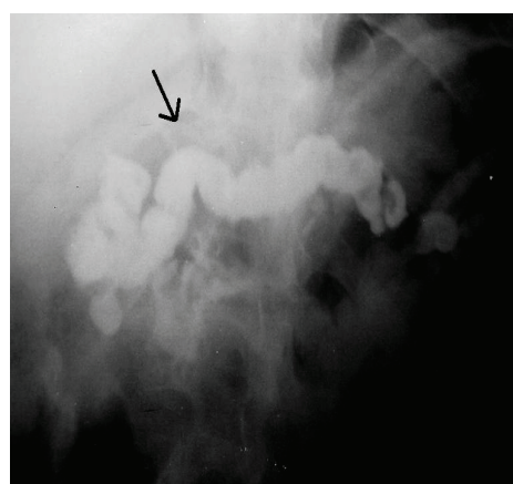
شکل - ۱: پانکراتوگرافی حین عمل: اتساع مجرای پانکراسی

که در تاریخ ۱۳۷۰/۶/۱۴ به درمانگاه جراحی بیمارستان قائم (عج) مراجعه نموده است، درد بیمار در ناحیه اپی گاستر با انتشار به دور کمر، از ابتدا شدید و مداوم بوده است بگونه ای که تزریق مواد مخدر نیز به مدت کوتاهی درد را تسکین می بخشید و حتی نظم بخش جراحی را به هم زده بود. در این مدت بیمار کاهش وزن به میزان ۱۵ کیلوگرم را نیز ذکر می نمود، در CT اسکن و سونوگرافی اتساع واضح مجرای پانکراس دیده نشده، آندوسکوپی انجام شده ولی انجام ERCP میسر نگردید. در آزمایشات انجام شده یافته ای غیر طبیعی دیده نشد و در محدوده نرمال بود. بیمار سابقه الکلیسم نداشت و در بررسی سنگ صفراوی نیز نداشت. همچنین لیپید و کلسیم سرم بررسی شد نرمال بود، هیچگونه سابقه درد شکمی قبل از شروع بیماری نداشته است. بالاچار بیمار لاپاراتومی گردید. پانکراس کوچک و نسبتاً سفت و سفید رنگ بود و در قسمت میانی مجرای پانکراس متسع و برجسته بود. پانکراتیکوگرافی حین عمل با ماده حاجب اوروگرافی