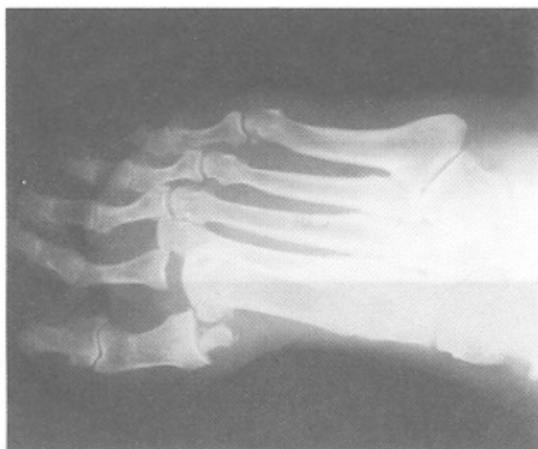
شکل ۲ - شکستگی سزاموئید لترال.

بیمار مرد ۸۰ ساله دیابتیک است که به دنبال عبور چرخ اتوموبیل از روی پایش دچار درد و تورم شده و به اورژانس مراجعه می نماید. در معاینه به عمل آمده علاوه بر درد و تورم در پا، دفرمیته در انگشتان اول و دوم پا به صورت دورسی فلکشن دفرمیته مشاهده شد. در رادیوگرافی های به عمل آمده، در رفتگی دورسال مفاصل متاتارسوفالانژیال اول و دوم مشهود بود (شکل ۱- الف و ب).