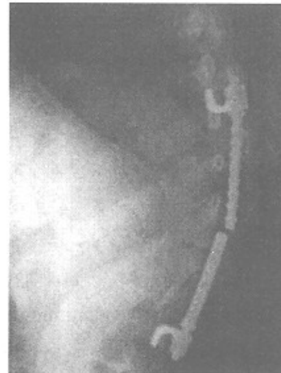
شکل ۱ - بیمار دچار کیفواسکولیوز کونژنیتال پس از سه سال

نتایج به تفکیک در گروهی که پیچ پدیکوله شکسته شده است: ۱- از بین رفتن اصلاح قوس جبرانی موجب شکسته شدن وسیله است (p value=0.05) ولی با از دست رفتن قوس ساختاری اولیه ارتباطی ندارد.