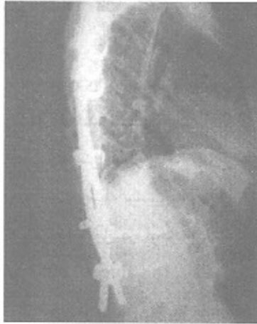
شکل ۲ - بیمار دچار اسکولیوز ایدئوپاتیکی پس از یکسال

۴- محل کارگذاری پیچ (خارج یا داخل مرکز پدیکل در رادیوگرافی قدامی- خلفی) در ایجاد شکستگی مؤثر است به فرمی که کارگذاری خارجی آن (نسبت به مرکز ساژیتال یا کروئال پدیکل) سبب ایجاد شکستگی وسیله است (شکل شماره سه). (p value=0.04)