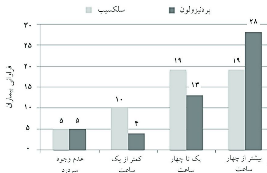
نمودار ۱: مقایسه مدت سردرد در طول روز بر حسب ساعت در گروه‌های مورد مطالعه

نشان داد بیمارانی که داروی سلکسیب مصرف کرده بودند از نظر سردرد دارای بیش‌ترین فراوانی در گروه ۱-۴ ساعت (۱۹ مورد) و بیش‌تر از چهار ساعت (۱۹ مورد) بودند. در حالی‌که بیش‌ترین