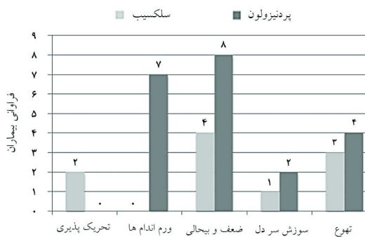
نمودار ۲: مقایسه بروز عوارض دارویی ایجاد شده در گروه‌های مورد مطالعه

*آزمون آماری: Student's t-test، P < ۰/۰۵ معنادار می‌باشد.